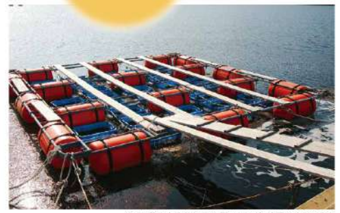
▲70個以上入るかがざりど並び、甘夏みかんの皮をエサに約200個以上のウニを育てている養殖場。