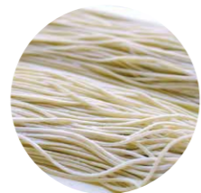
▲年末には地元・宗像で生産されるそば粉を使った年越しそばが登場予定。

こだわって製麺していると教えていただきました。延ばした生地は再び製麺機にかけて裁断し、1日ほど熟成させればうどん麺の完成です。「山田製麺」のうどん麺は、もっちりしつとも程よくコシのあるやわごじ食感が特徴的。つるんとした喉ごしも心地よく、温かい麺はもちろん冷たい麺にしても最高です。その美味しさの秘訣には、土地の恵みも関わっていると祐一郎さんは言います。「ここ宗像市久原の一帯は近くの許斐山(このみやま)がもたらす美味しい水に恵まれた地域で、平清水と呼ばれるんです。その地下水と県産の小麦粉、塩だけで製麺することで旨みを引き出