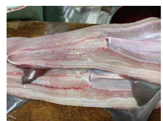
▲八尋さんは生きたものを新鮮なうちに捌くため、身もキレイ。