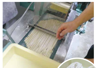
▲生地をカットする工程。麺の種類(うどん、細麺・中太麺・太麺の中華麺)で刃の幅を変えます。