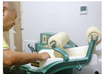
▲製麺機のローラーに生地を入れ、二重にして圧力をかけ、薄く延ばしていく工程。